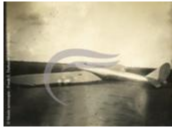
[VIDE] (2 NUM 5)