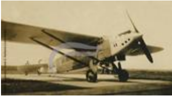
Latécoère 28 (2 NUM 70)