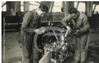
Moteur 450R Renault (2 NUM 62)