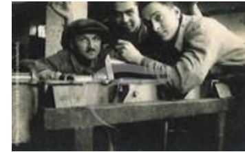
[VIDE] (2 NUM 73)