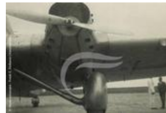
Moteur Hispano-Suiza 12 du Couzinet 70 Arc En Ciel (PHnum.DUT.013)