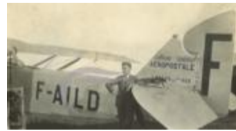
Latécoère 26 (2 NUM 32)