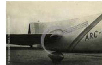
La fameuse dérive "Induite" du Couzinet 70 (PHnum.DUT.010)