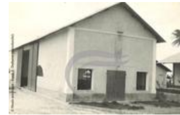
Hangar à Maceió (2 NUM 61)