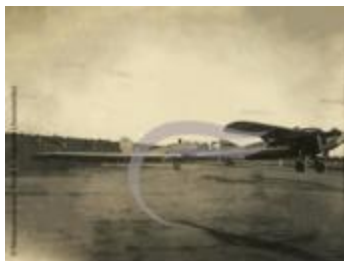
[VIDE] (2 NUM 42)