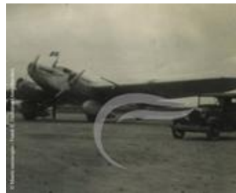
L'Arc En Ciel à Natal (PHnum.DUT.012)