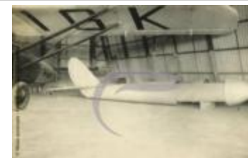
[VIDE] (2 NUM 65)