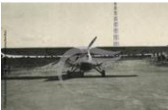
Le De Havilland DH.80A Puss Moth de Bert Hinkler (2 NUM 38)