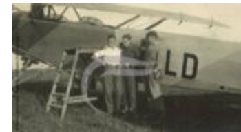
Latécoère 26 (2 NUM 37)