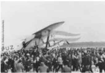
Farman F.2231 (2 NUM 22)