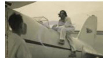
Laura Ingalls et son avion