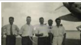
[VIDE] (2 NUM 91)