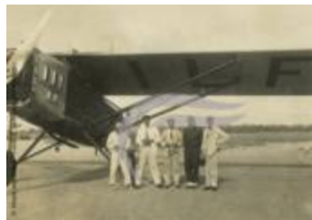
Groupe posant devant un Latécoère 26 (2 NUM 35)