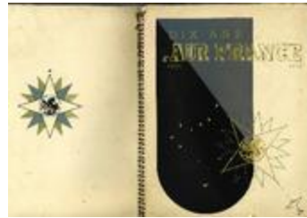
Dix ans d'Air France 1933-1943 (2 NUM 96)