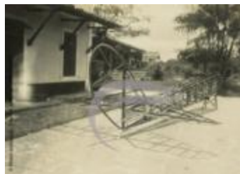
[VIDE] (2 NUM 39)