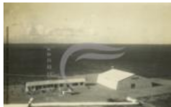
Hangar Maceió (2 NUM 10)