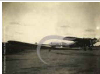
[VIDE] (2 NUM 48)