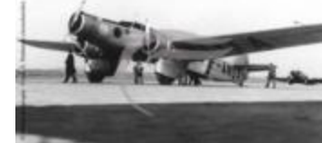
Dewoitine 333 L-ANQA (2 NUM 21)