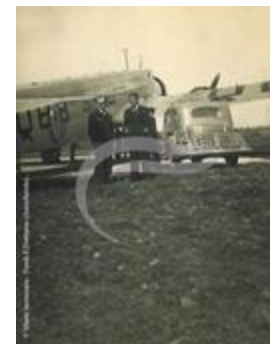
Le Dewoitine 338 "Ville de Toulouse" (PHnum.DUT.109)