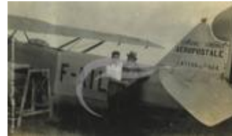
Latécoère 26 (PHnum.DUT.113)