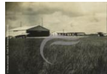
Maceió (2 NUM 29)