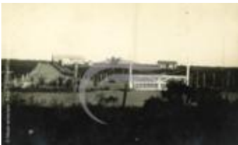
Camp d'aviation Maceió (2 NUM 9)