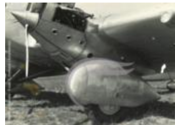
Maintenance moteur sur le Couzinet 70 Arc En Ciel (2 NUM 11)