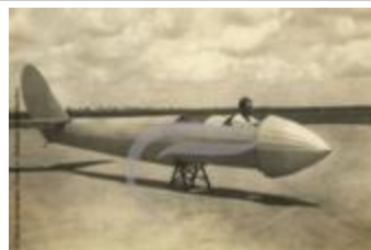
[VIDE] (2 NUM 84)