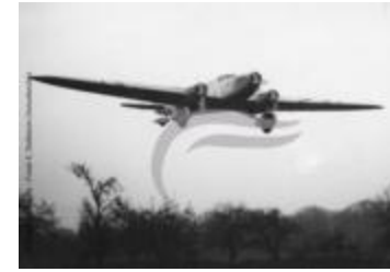
Le Couzinet 70 Arc En Ciel de retour à Natal (2 NUM 016)