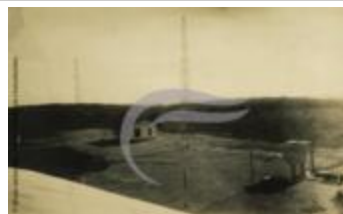
Tour radio à Maceió (2 NUM 55)