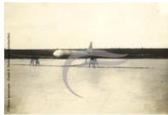
[VIDE] (2 NUM 59)