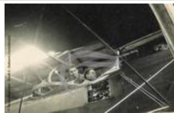
[VIDE] (2 NUM 63)