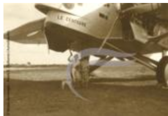
Farman 220 "Centaure" (PHnum.DUT.106)