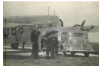
Dewoitine 338 "Ville de Toulouse" (2 NUM 36)