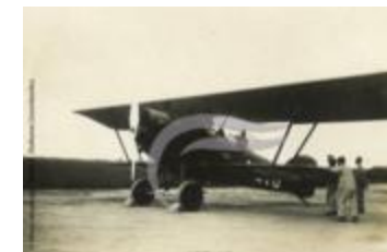
Potez 25 (PHnum.DUT.96)