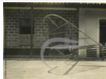
[VIDE] (2 NUM 45)