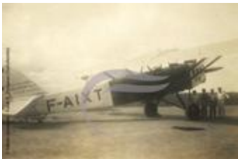
Latécoère 26 (PHnum.DUT.101)