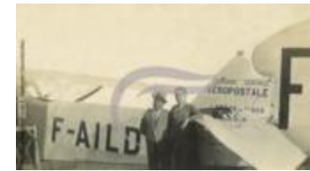
Latécoère 26 (2 NUM 33)