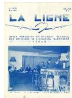
La ligne. Revue mensuelle du syndicat national des officiers de l'aviation marchande. SNOAM