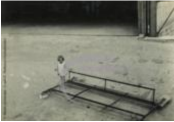
[VIDE] (2 NUM 18)