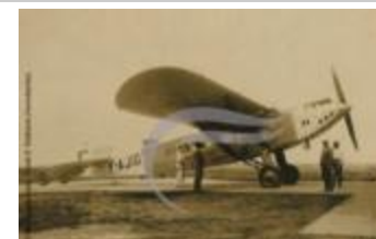
Latécoère 28 (2 NUM 89)