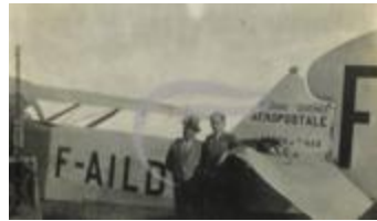
Latécoère 26 (PHnum.DUT.111)