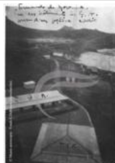
Vue sur les installations de Maceió (2 NUM 56)