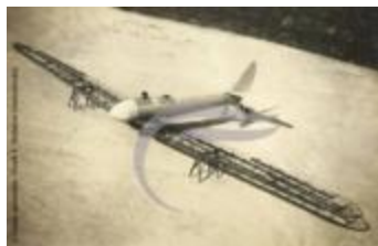
[VIDE] (2 NUM 82)