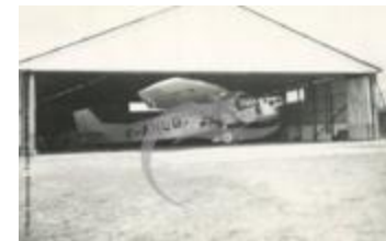
Farman 220 dans un hangar (PHnum.DUT.104)