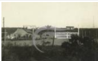
Aérodrome de Maceió (2 NUM 54)