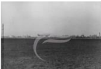
Couzinet 70 Arc En Ciel (2 NUM 13)