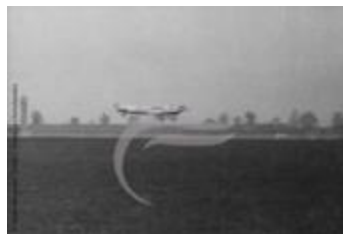
Couzinet 70 Arc En Ciel (2 NUM 14)