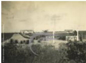
Une piste de Maceió (PHnum.DUT.115)