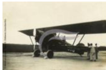
Potez 25 (PHnum.DUT.102)