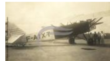
Latécoère 26 (2 NUM 69)