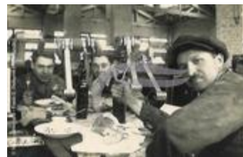
Repas dans un atelier à Maceió (2 NUM 40)