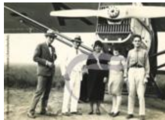
Groupe posant devant un Latécoère 26 (2 NUM 24)