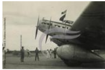
L'Arc En Ciel à Natal (PHnum.DUT.011)