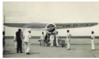
Laura Ingalls pose avec son avion devant les photographes (2 NUM 03)