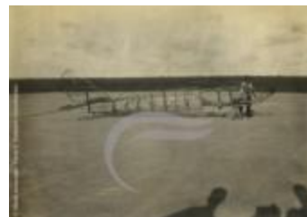
[VIDE] (2 NUM 15)