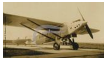
Latécoère 28 (2 NUM 68)