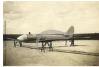
[VIDE] (2 NUM 60)