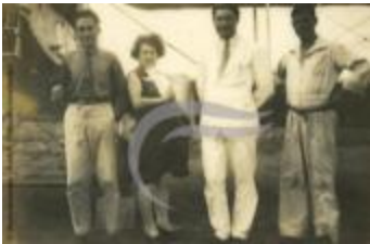
[VIDE] (2 NUM 74)