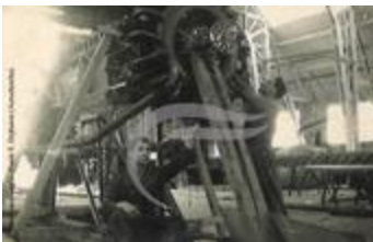
[VIDE] (2 NUM 26)