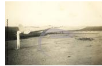
[VIDE] (2 NUM 77)