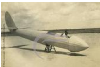
[VIDE] (2 NUM 86)