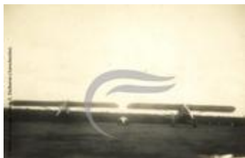
Deux Latécoère 26 (2 NUM 47)