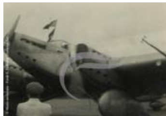
L'Arc En Ciel moteur tournant (PHnum.DUT.015)