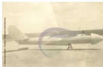
[VIDE] (2 NUM 79)