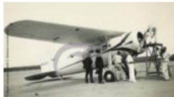
Maintenance sur le Lockheed Air Express de Laura Ingalls (2 NUM 06)