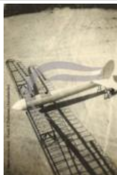
[VIDE] (2 NUM 83)