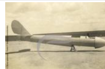
[VIDE] (2 NUM 85)