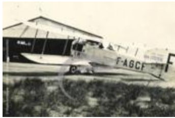
Breguet XIV (PHnum.DUT.110)