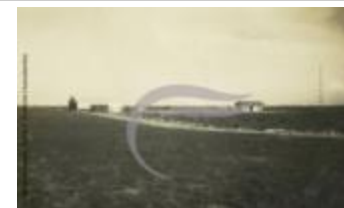
Aérodrome de Maceió (2 NUM 57)