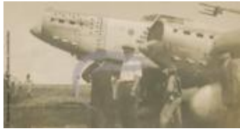
Mécaniciens devant le Couzinet 70 Arc En Ciel (2 NUM 017)