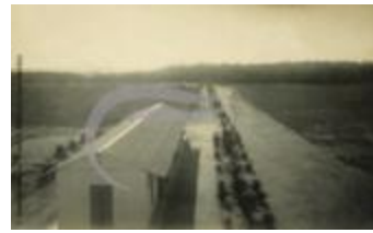
Maceió (2 NUM 6)