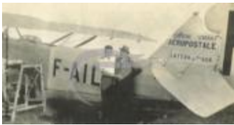
Latécoère 26 (2 NUM 34)