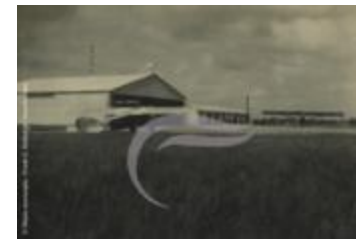
Tarmac de Maceió (2 NUM 25)