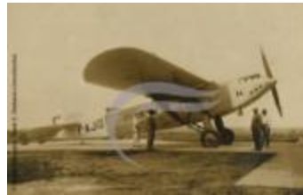
Latécoère 28 (2 NUM 71)