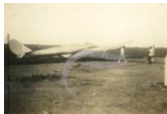
[VIDE] (2 NUM 80)