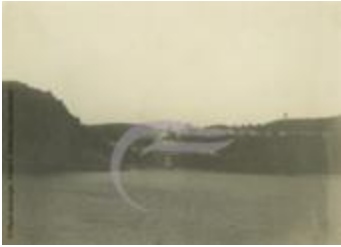
[VIDE] (2 NUM 30)