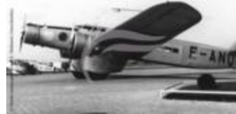
Dewoitine 333 "Antarès" (2 NUM 20)