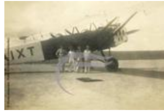
Latécoère 26 (2 NUM 72)