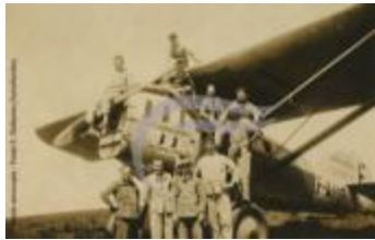
Groupe devant un Latécoère 25 (2 NUM 58)