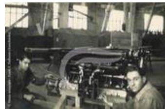
Moteur Renault (PHnum.DUT.117)