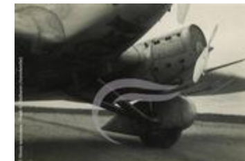
Train d'atterrissage du Couzinet 70 Arc En Ciel (PHnum.DUT.014)