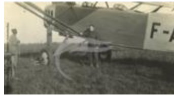
Latécoère 26 (2 NUM 31)