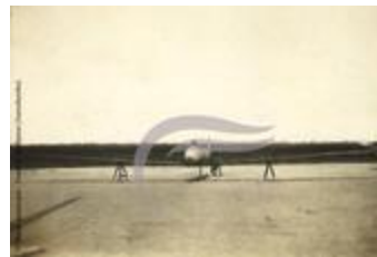
[VIDE] (2 NUM 76)