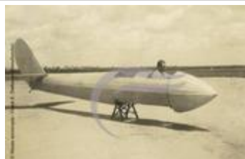
[VIDE] (2 NUM 43)