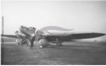
Couzinet 70 posé à Natal (2 NUM 09)