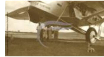
Farman 220 "Centaure" (PHnum.DUT.100)