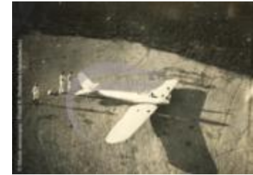
[VIDE] (2 NUM 7)