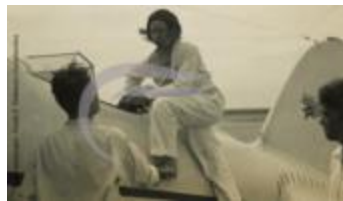
Laura Ingalls pose sur son avion (2 NUM 02)