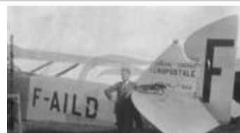
Latécoère 26 (2 NUM 50)