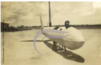
[VIDE] (2 NUM 78)