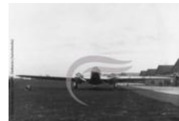
Couzinet 70 Arc En Ciel (2 NUM 17)