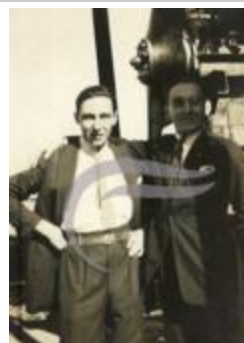
[VIDE] (2 NUM 88)