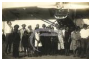
Groupe devant un Latécoère 26 (2 NUM 93)

A la mémoire des pilotes, navigateurs, radiotélégraphistes, mécaniciens navigants et agents de la compagnie Air France ayant donné leur vie pour la ligne Toulouse-Santiago-du-Chili duthuron (2 NUM 94)