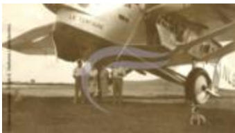
Farman 220 "Centaure" (PHnum.DUT.105)