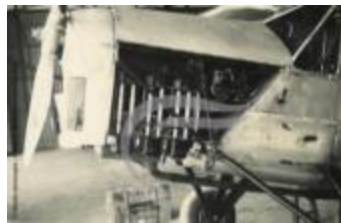
Maintenance sur le moteur de l'avion de Bert Hinkler (2 NUM 75)