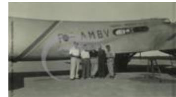
Couzinet 70 Arc En Ciel (2 NUM 08)