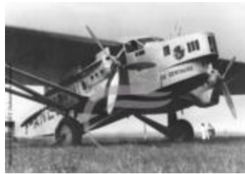
Un Farman 220 d'Air France (2 NUM 19)