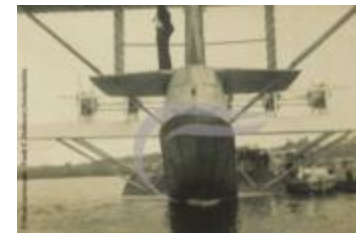
Dornier Do X (2 NUM 12)