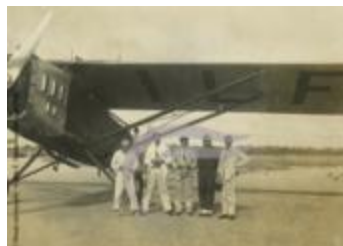
Groupe posant devant un Latécoère 26 (2 NUM 27)