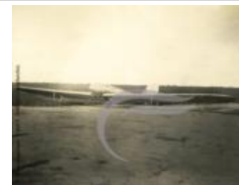
[VIDE] (2 NUM 46)