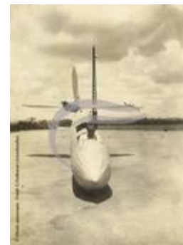
[VIDE] (2 NUM 81)