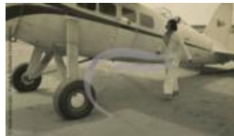
Laura Ingalls et son Lockheed (2 NUM 07)