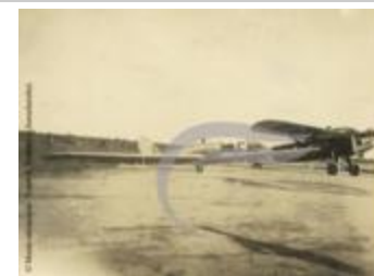
[VIDE] (2 NUM 53)