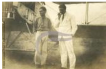
[VIDE] (2 NUM 66)