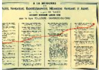
A la mémoire des pilotes, navigateurs, radiotélégraphistes, mécaniciens navigants et agents de la compagnie Air France ayant donné leur vie pour la ligne Toulouse-Santiago-du-Chili (2 NUM 95)