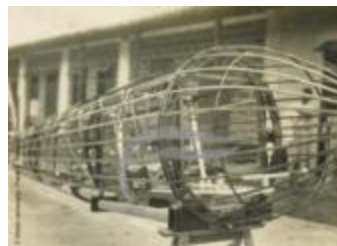
[VIDE] (2 NUM 28)