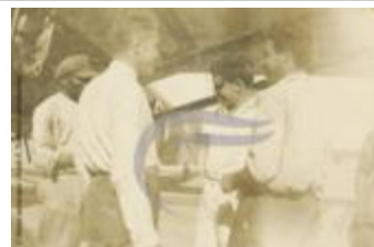
[VIDE] (2 NUM 64)