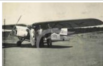
Bert Hinkler et son De Havilland DH.80A Puss Moth (2 NUM 87)