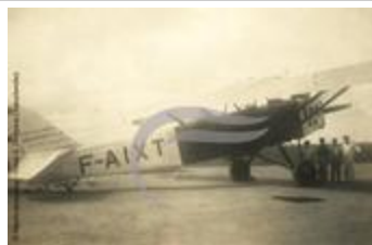
Latécoère 26 (2 NUM 92)