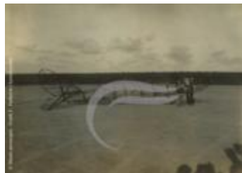
[VIDE] (2 NUM 23)