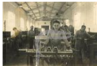
Atelier mécanique à Maceió (PHnum.DUT.107)