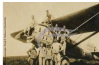
Groupe devant un Latécoère 25 (2 NUM 67)